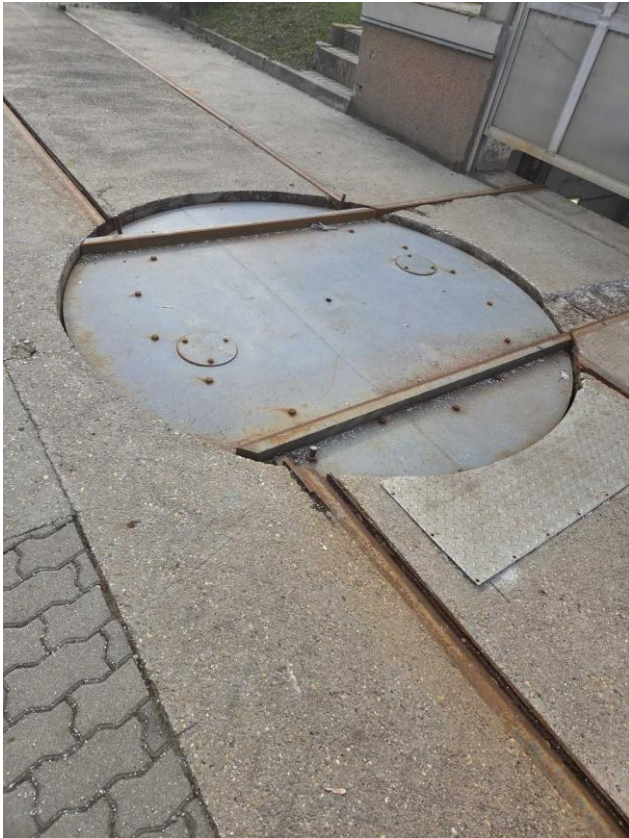
2-es emelőasztal motoros konténerforgató korong.