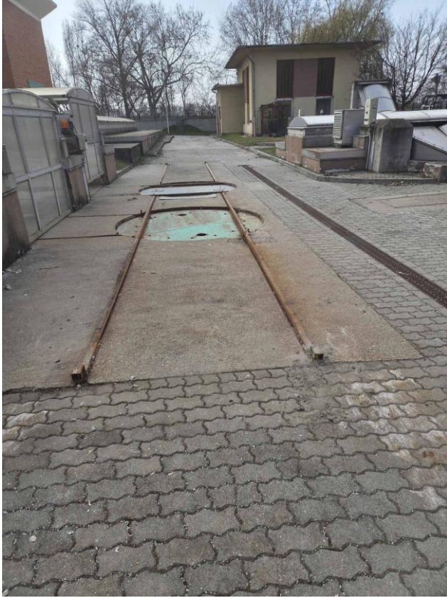
1-es és 2-es emelőasztal konténerforgató és sín.