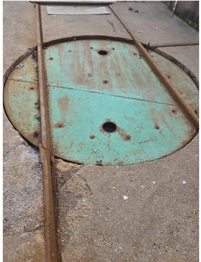
1-es emelőasztal konténerforgató korong