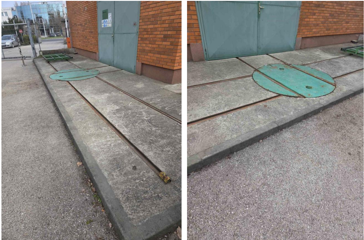
Zápor oldali konténerforgató korong és sínrendszer.