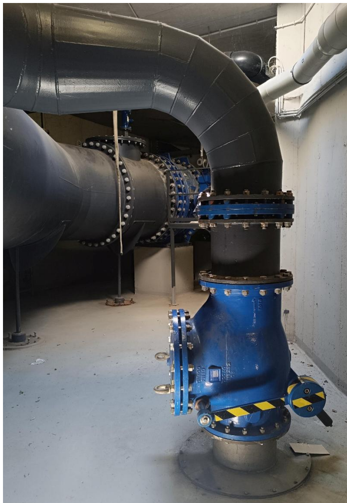
DN400-as, egykaros hidraulikus csillapítású visszacsapó, közdarabba